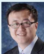
杨斌 中国 清华大学副校长、教务长 清华大学教育基金会理事长