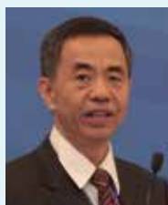
吴国凯 中国 中国工程院副秘书长 中国工程院一局局长