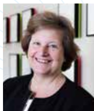
Dame Ann Dowling