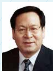
顾秉林 中国 清华大学前校长 中国科学院院士