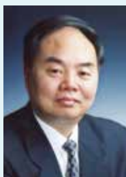
周济 中国 中国工程院院长