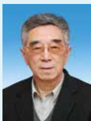
朱高峰 中国 中国工程院前副院长